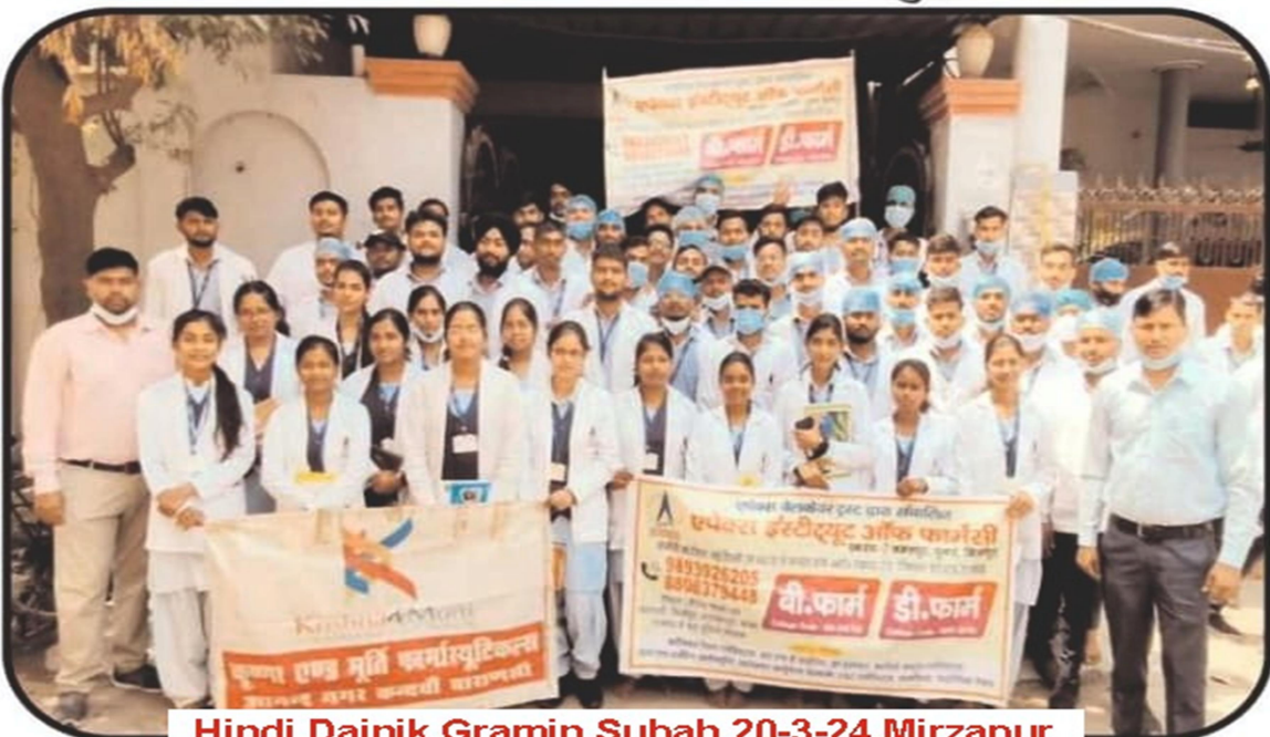
Hindi Dainik Gramin Subah 20-3-24 Mirzapur

संपर्क करते हुए शैक्षिक भ्रमण हेतु अनुमोदन प्राप्त किया। औद्योगिक भ्रमण के दौरान छात्रों ने उत्पादन प्रबंधन, टेस्टिंग लैबोरेटरी, ड्रग्स मैनुफेक्चरिंग एंड पैकेजिंग का लाभ उठाते हुए उत्पादन के समय