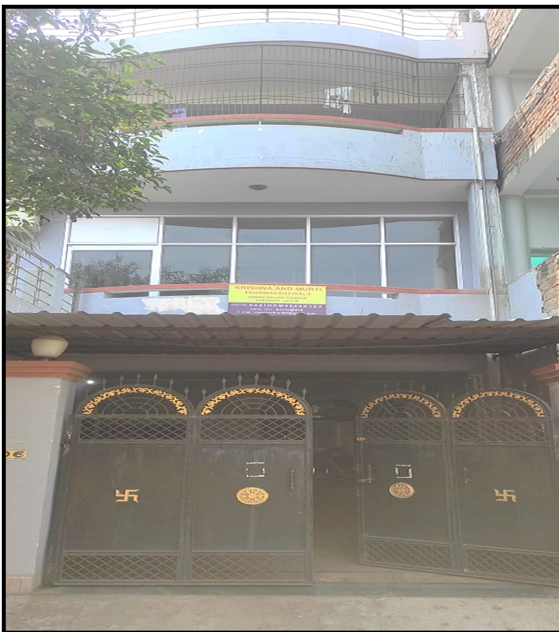
Main Buliding Krishna and Murti Pharmaceuticals

of a product leads to the intended level of quality performance in the market. This commitment to Quality requires us to ensure that our facility is geared up to provide the right environment, our personnel are trained and Quality conscious. These factories are well equipped with modern automatic plant. Our plants have additive production capacity to match marketing aspiration and have separate sections namely tablet Section, capsule sections, syrup Sections, injectable section and ointment section. Efficiency of Pharma depends on quality. We are Conscious of it for maintaining high quality control. During manufacturing process .The entire process is carrying under GMP assisted by well equipped analytical Laboratory.