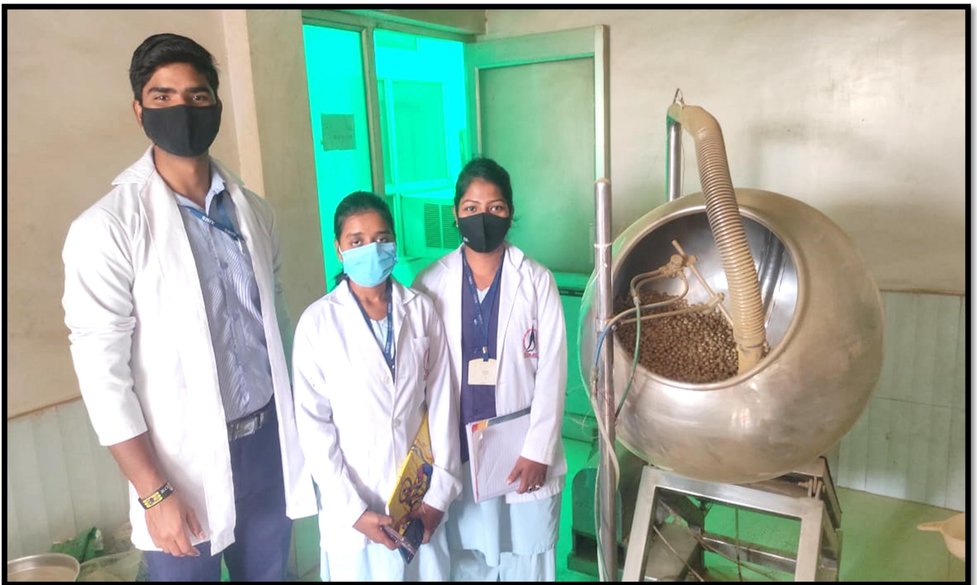
Tablet Coating section