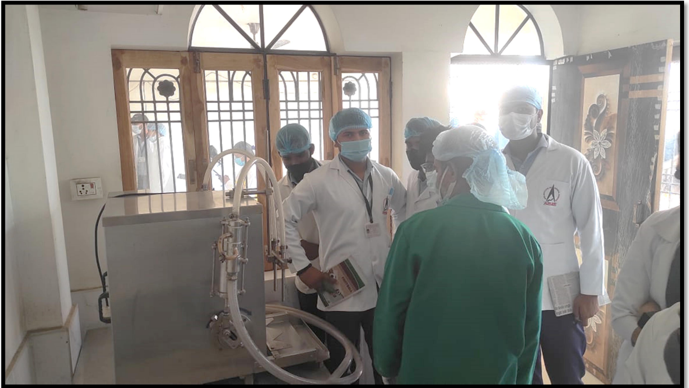
Syrup filling section