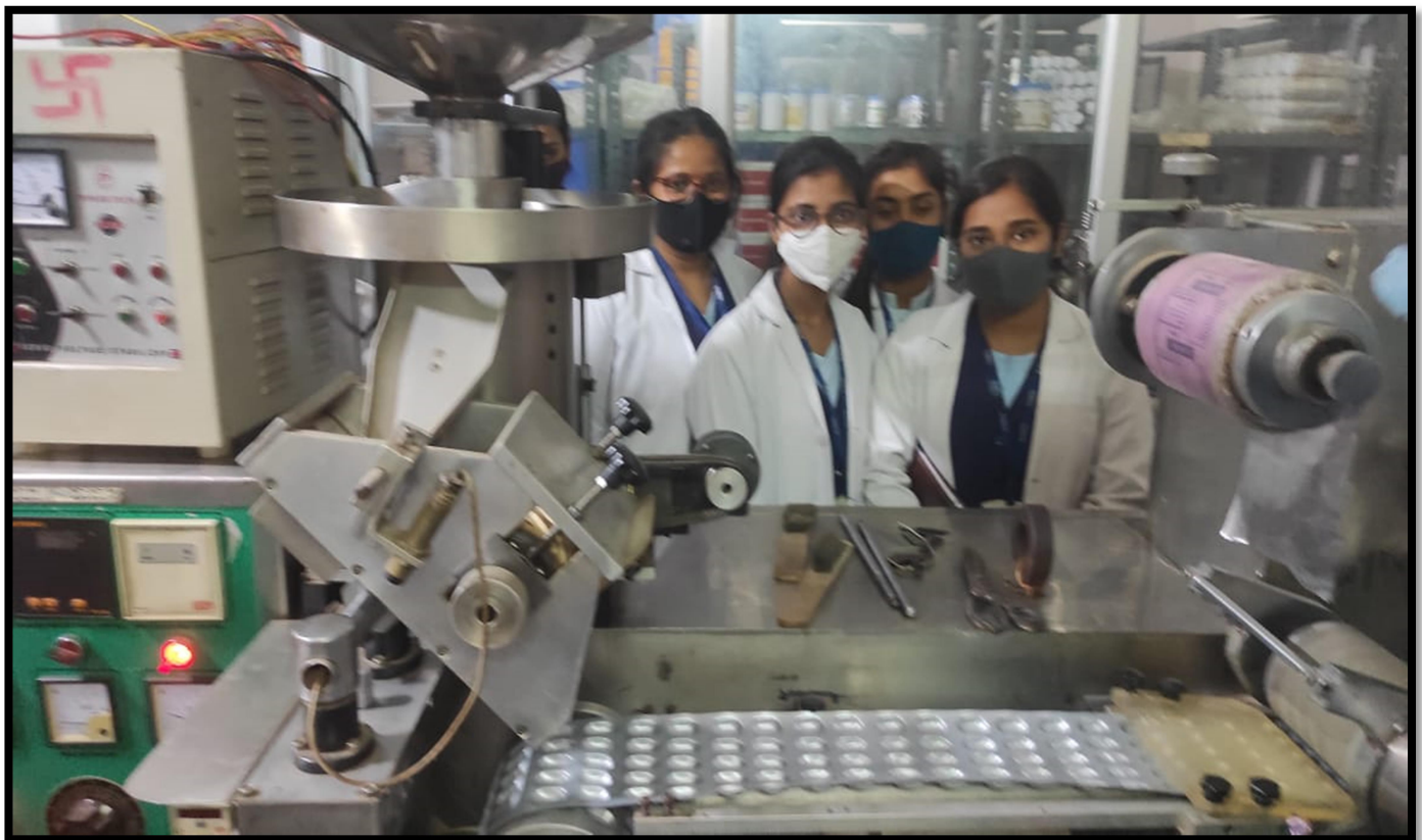
Packaging of capsule